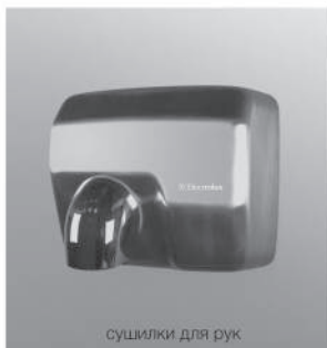
сушилки для рук